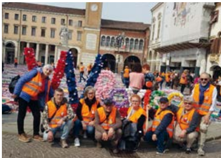
ROVIGO - 17 Marzo 2024 Piazza V. Emanuele II

Il 17 marzo 2024, in piazza Vittorio Emanuele II a Rovigo sono stati stesi i teli di plastica. Alle 6,30 è partita la catena umana da via Annonaria, il Mercato Coperto per raggiungere la piazza e, con calzari per non rovinare i capolavori, stendere di conseguenza ciascuna coperta; gli strati che sono risultati da tutte le coperte completate sono stati tre, tanto è stato il lavoro fatto (12.000 quadrati per formare 6.000 coperte). Alle 9 di mattina è stato dato inizio all'evento, ed i visitatori hanno potuto scegliere la propria coperta offrendo in cambio una donazione, il ricavato è stato devoluto al Centro Antiviolenza di Rovigo.