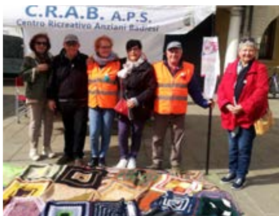
Gazebo Badia Polesine - 1 Maggio 2024